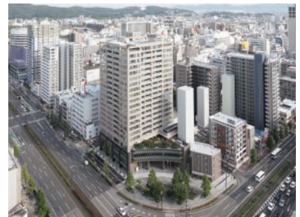
ハレクロスタワー (北区中山下一丁目)