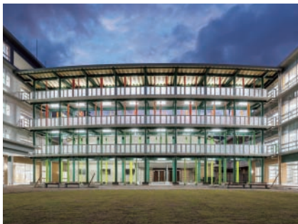
市立鹿田小学校 (北区大供表町)