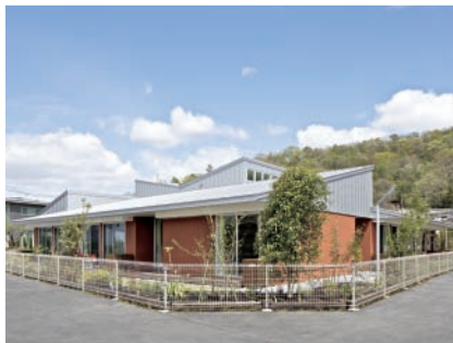
グループホーム楽し愛 (北区吉宗)