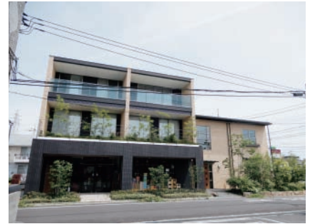
UJO RICO de VIN (北区東古松)