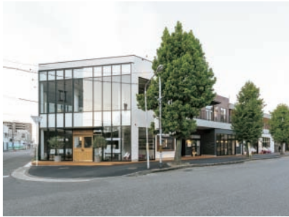
問屋町テラス (北区問屋町)

今年度は応募作品22点の中から、岡山市景観審議会の現地視察と選考会を経て市に答申された、建築物部門6作品を決定しました。表彰作品の名称・所在地などは、次のとおりです。