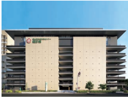
岡山済生会予防医学健診センター ・駐車場棟 (北区伊福町一丁目)