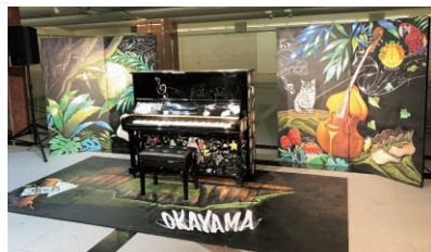
▲2019年度主催事業「ストリート・ピアノ」

問申市スポーツ・文化振興財団 ☎086-232-7811 〒700-0825 北区田町一丁目8番30号伊達ビル3階 応募資格市内に活動拠点を置き、文化芸術活動を行っている団体や市民グループ(個人や営利企業、プロモーターなどは不可) 応募事業美術、演劇、舞踊、音楽、文芸、伝統芸能、生活文化、その他の芸術に関するもので、原則として芸術祭期間中(令和2年9月26日～12月31日)に市内で開催する文化事業 助成対象経費の1/3以内(上限は100万円)を予算の範囲内で一部助成 募集要項(文化振興課、同財団で配布、同財団HPからも入手可)を確認の上、☎・図で2月28日までに