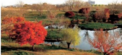
▲せせらぎ広場(ホタル池周辺)

ちの格好の水遊び場となっています。春には桜も咲き、お花見も楽しめるなど、子どもから大人まで多くの皆さんに親しまれています。