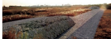
▲一の荒手 手前は上流巻石部(亀の甲)

なお、ゴミを持ち帰るなどマナーを守って利用するとともに、大雨などで増水したときには川に近寄らないなど、安全には十分注意して楽しみましょう。