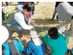
F 百間川の春を食べよう!