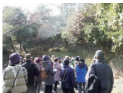
B 四季と自然を楽しむ会