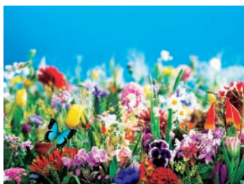
earthly flowers, heavenly colors (2017) ©mika ninagawa, Courtesy of Tomio Koyama Gallery

期間 2月1日(土)～3月31日(火) 費 一般1,300円、中学・高校生 800円