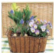
A 芽出し球根の寄せ植えづくり

☎ 3月22日(日)10時～13時 内 川辺の散策と野草採取、調理・試食 定 先着25人 費 一般300円、小学生以下200円(保険代含む) 場 百間川山陽新幹線高架下右岸河川敷(中区竹田) 持 お問い合わせください。 申 行事名、住所、氏名(フリガナ)、年齢、電話番号、ファクス番号を ☎・☎ で3月15日までに