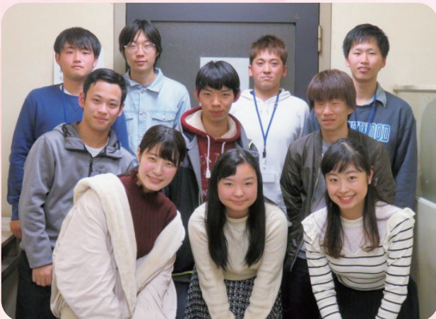
▲昨年11月22日の実行委員会にて

新成人となる私たちは、過去から今日、そして未来へ、人と人、心と心をつなぐバトンを渡していけるような式になることを願い、テーマを決めました。感謝の気持ちをいつも大切にし、未来で大きな実を結ぶようこれからも歩み続けて行きましょう。