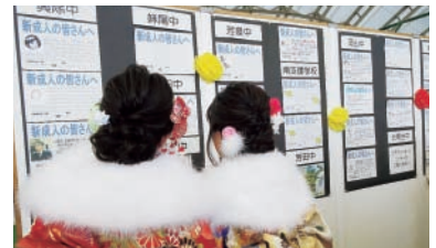
▲メッセージを読む新成人

中学校卒業時の先生方からいただいたビデオレターやメッセージカードの展示を行い、紹介します。