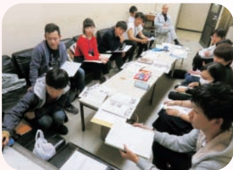
▲実行委員会の様子

今まで支えてくださった人に「感謝」の気持ちを伝えること。これからもたくさんの人から「刺激」を受けて成長すること。改めて自分自身を見つめ直し、「自覚と責任」をもつこと。「夢」を持って、明るい未来に向かって進むこと。これらを私たちは大切にしていきたいと思えます。