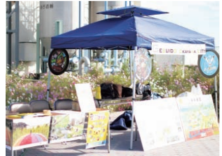
▲下水道PRブースの様子

コスモス畑の一般開放中には昨年に引き続き、下水道広報班による下水道PRブースを開設。家族で楽しめる企画を予定していますので、詳細は同センターHPをご覧ください。