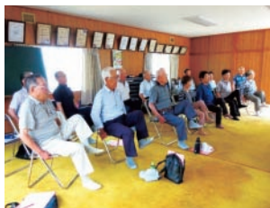
▲体操に取り組む参加者の様子

体操で元気になることはもちろん、住民が主体となって住み慣れた地域で活動することにより、高齢になっても地域とのつながりを持ち続けられます。また、体操以外にもさまざまな活動が生まれており、