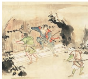
「桃太郎絵巻(部分)」岡山シティミュージアム蔵