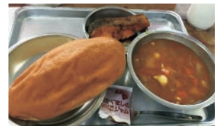
▲G20給食 ミネストローネ

岡山駅東西連絡自由通路のデジタルサイネージや工事現場仮囲いでもG20岡山保健大臣会合をPRしています。ぜひ探してみてください。