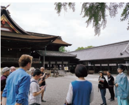
▲海外プレスツアーの様子

参加された海外プレス担当者により、すでに、複数の海外メディアで岡山の情報が発信されています。