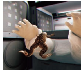
John Gerrard X. laevis (Spacelab), 2017 Courtesy of the artist, Thomas Dane Gallery, London and Simon Preston Gallery, New York

アーティストの思考に遭遇し、時間や歴史、国境などを行き来するような芸術との交流が楽しめます。