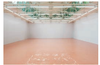
Pamela Rosenkranz Our Product, 2015 Courtesy of the artist and Pro Helvetia, Karma International, Zurich, Miguel Abreu Gallery, New York, and Sprüth Magers Gallery, New York Photo: Marc Asekhome