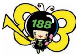
消費者庁「イヤヤン」

「悪質商法などによる被害にあった」「ある製品を使ってけがをしてしまった」などの消費者トラブルで困っていることはありませんか? そんなときは一人で悩まずに、全国どこからでも3桁の電話番号でつながる消費者ホットライン「188(いやや!)」にご相談ください。専門の相談員がトラブル解決を支援します。