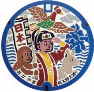
岡山市のマンホール蓋 (特別に彩色されたもの 岡山シティミュージアム蔵)

期間 令和2年1月19日(日)まで開催中 費 一般310円、大学・高校生210円