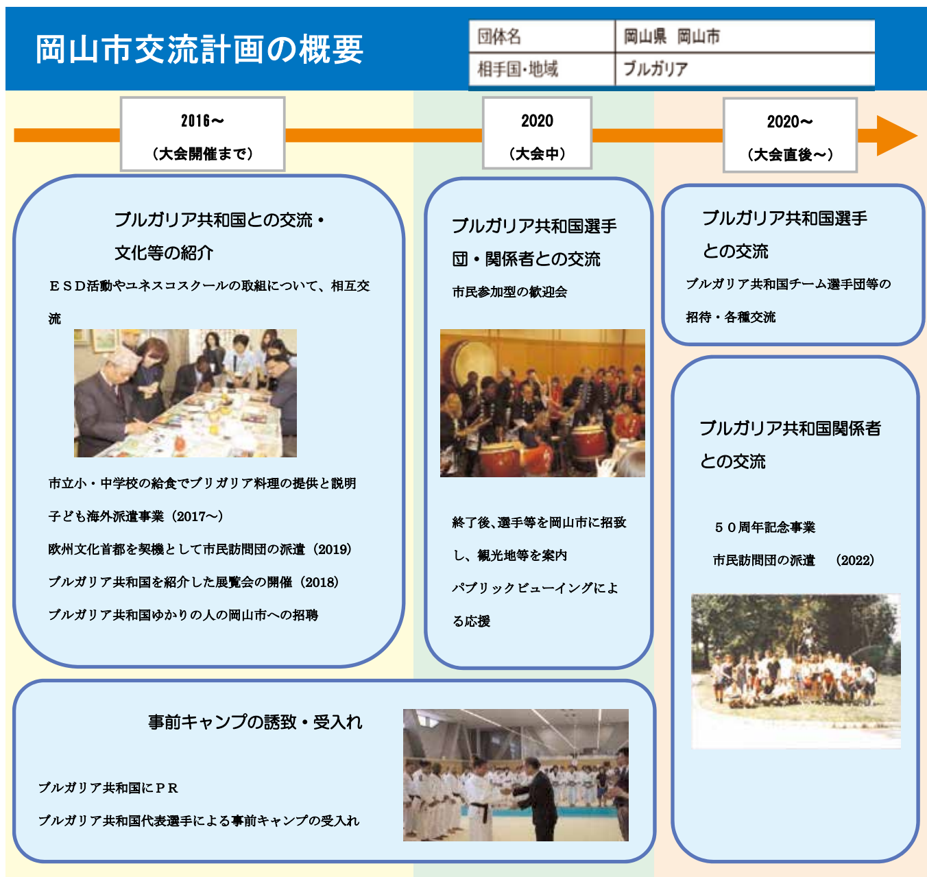
図4 ホストタウン事業の概要