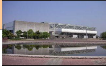
岡山市総合文化体育館