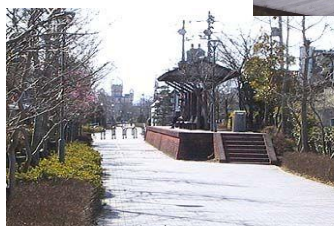
臨港グリーンアベニュー