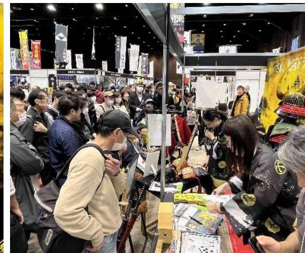
宇喜多大河プロジェクトメインビジュアルとお城EXPO(横浜市)でのプロモーション