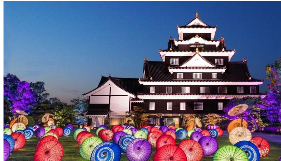
夏の烏城灯源郷の様子

かつて多くの櫓や建物で威容を誇った岡山城本丸をCGで復元し、VR等で楽しめる新たな体験コンテンツを制作します。