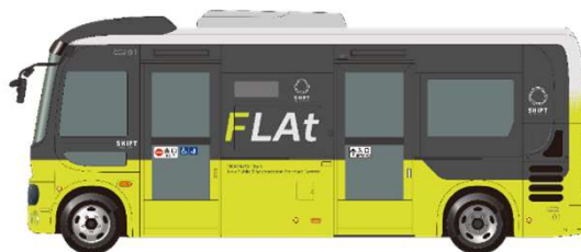
（支線バスの車両デザイン）