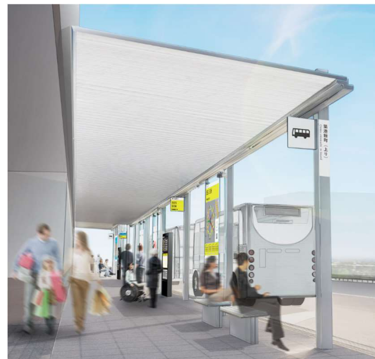
（乗継拠点整備イメージ）