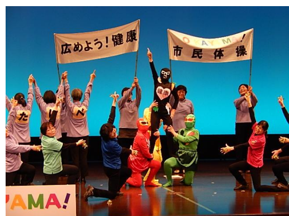
最優秀賞: たけべ栄養鮮隊