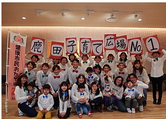
最優秀賞: ほぼ20周年記念! 鹿田子育て広場