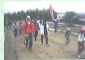
ふれあいウォーキング