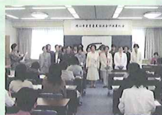
愛育委員協議会総会