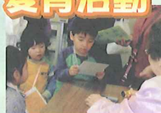
元気歯ツラツin西大寺