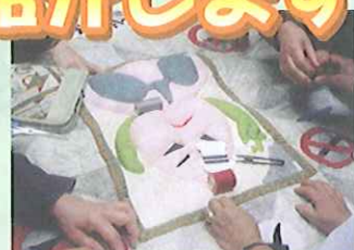
健康づくりキルト作製