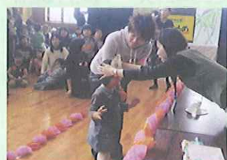
おやこクラブ卒会式