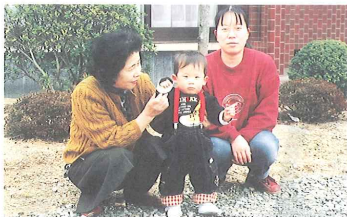
「声掛け訪問」のひとつ

20年前から、毎月定期的に声掛け訪問を行なっていますが、最近では月、延べにして70～90件くらいでしょうか…。住宅事情も変わり、お宅へ伺うことが少なくなり、外でお子さんとお遊んでいるときなどに様子を聞くようになりました。近ごろ、お子さんのアトピーやぜんそくに悩まれるお母さんが増えているようです。