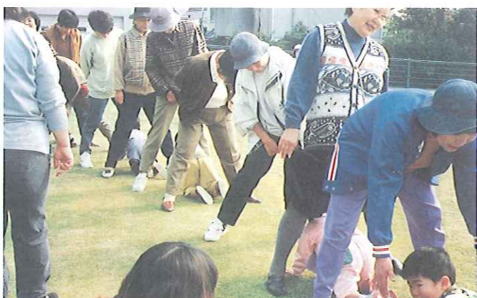
足の間を楽しそうにくぐる子どもたち

コミュニティハウス横の広場で、歌ったり踊ったり。ロープの自動車ポッポは手をつないだ大きいトンネルに、また、足の間の小さなトンネルを子どもたちはハイハイで嬉しそうにくぐります。走ったり転がったり、子ども親も、そしてわたしたち愛育委員もみんな笑い声いっぱいです。