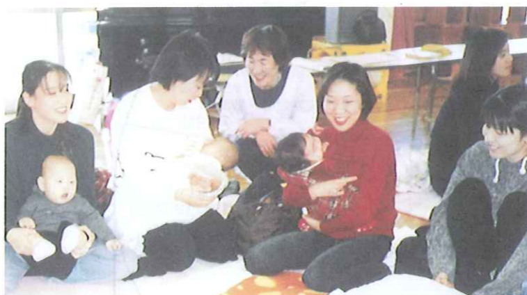
なごやかなムードの「新米ママの子育て教室」

出産して間もない不安の多い母親を対象に育児の知識や知恵を学びながら、母親どうしが助け合い、子育ての問題を解決していける仲間づくりができるきっかけになればと「新米ママの子育て教室」を開いています。愛育委員会ではお誘いピラを作って、近所の新米ママさんに届けます。当日は受付、計測、託児などするほか、話し合いにも加わり、子育ての先輩として相談されることもありました。✓