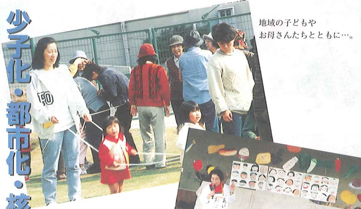
地域の子どもや お母さんたちとともに...