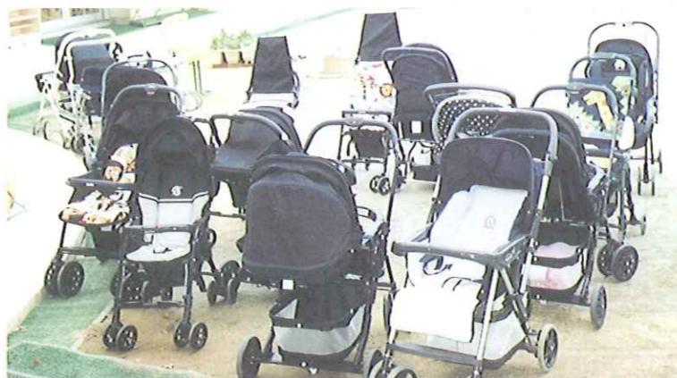
新米ママさんの素敵な笑顔に出会える1日

平成10年度は6回開催し、延べ190組の母と子が参加されました。今年は8回開催の予定です。