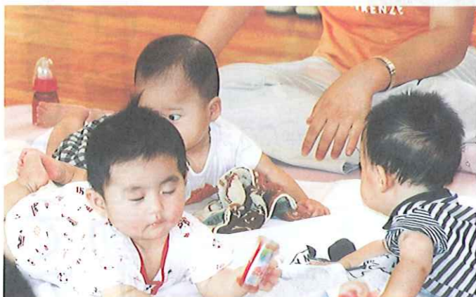
お母さんどうしの交流の場である「ママさんコーナー」