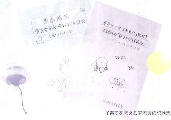
子育てを考える交流会の記録集