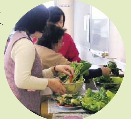
野菜の量を手ばかりで…