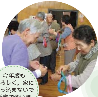
今年度もよろしく。家に引込まないで教室で会いましょうね

91人の愛育委員が、声かけ訪問を基本とした活動を中心に、元気な地域づくりのため頑張ってます。