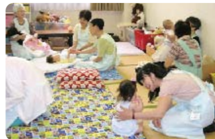
愛育委員の子守でお母さんを待つ赤ちゃん

今後も、行政の指導を受けながら、乳幼児から高齢者までの健康を願って、「愛と奉仕」の心で、地域に密着した地道な愛育活動を続けていきたいと思っています。