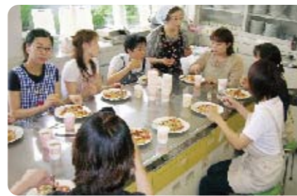
仲良くパン作りをするお母さん達

誕生1~3カ月赤ちゃんの家庭に、お祝いのメッセージを書いたカードを持って訪ねる「赤ちゃん誕生お祝い訪問」は、平成7年より続けている活動です。また、訪問したお母さん達を対象とした「子育て教室」は大好評で、一緒にパン作りをすることを通して、初対面のお母さん同士が仲良くなり、その地域での仲間づくりのきっかけとなっています。