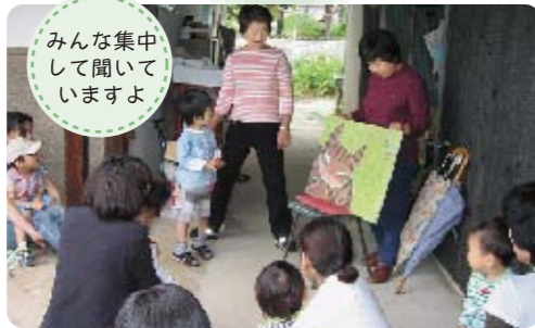
子育て支援センターでの絵本の読み聞かせ

化の進む中、子育てに不安を持つ親のため、子育て支援「すみれ会」を中心に絵本の読みきかせや、子育ての情報交換や、友達づくりのための支援活動をしています。