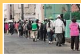
ウォーキングの様子

マンション・住宅が急激に増え、核家族層の人口が多い学区です。毎年11月末、世代を越えた人とのつながり・健康づくりを目的にウォーキングしており、今回は、蟹八幡コースに幼児を含む約100名が参加しました。「OKAYAMA! 市民体操」から始まり、笹ヶ瀬川土手を北上、地域の素晴らしい旧跡を訪ね、晩秋を楽しみながら、賑やかに歩きました。ゴール後は、手作りぜんざいをいただき、ほっこり笑顔で解散となりました。