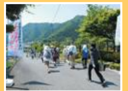
ウォーキングの様子

県のほぼ中央に位置し、旭川の豊かで涼やかな流れに、昔は高瀬舟が行き来し、山城がいくつもあるという歴史のある土地柄です。五月晴れの中、承芳ふれあい広場を出発し、宇甘神社、星原水車小屋等、ゴールの河原邸を目指して、観光ボランティアの説明を聞きながら歩きました。宇甘神社の大きなイチヨウの木に圧倒され、水車小屋は新しくなって、現在も使われています。陽射しの強さや川のせせらぎなど、歩くからこそ感じられる自然を満喫しました。御津の地を歩きに来て!!