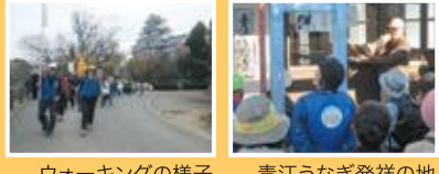
ウォーキングの様子 青江うなぎ発祥の地

岡輝中学校区は、清輝・岡南学区が毎年担当を交代しながら、ウォーキング大会を開催しています。江戸時代の町名(大工町など)が残る町を歩き、岡山城・後樂園をめぐる「歴史探訪コース」、江戸時代にうなぎの漁業権があった青江をめぐる「青江うなぎコース」など、地域の魅力があふれたコースを歩いています。愛育委員会だけでなく、地域の様々な組織と連携を取り、ウォーキング大会を通じて運動習慣の定着、健康増進を目指し、楽しく活動しています。