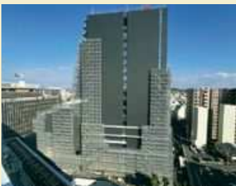
▲西面の外装の進捗状況