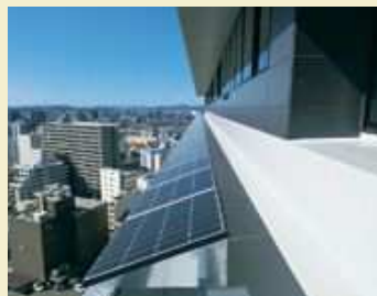
▲南面の庇に設置した太陽光パネル