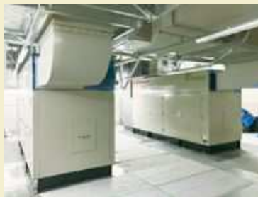
▲5階の発電機室に設置された非常用発電機