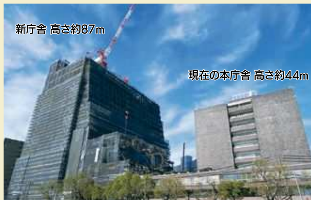
▲最上階の17階まで鉄骨が到達した新庁舎（左）と現在の本庁舎（右） （令和7年3月時点）