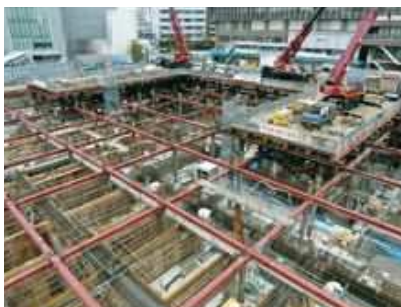
▲地下工事の状況 (令和6年3月中旬時点)