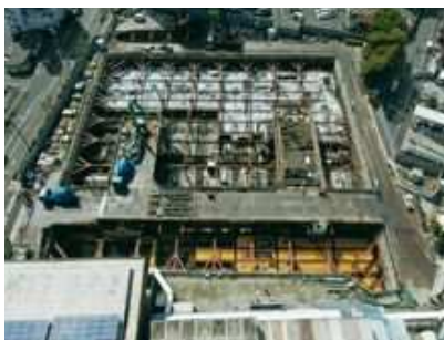
▲工事現場の様子 (令和6年3月末時点)