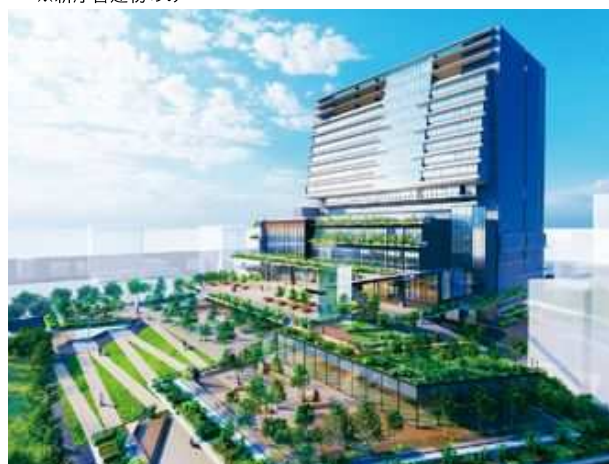
▲新庁舎外観イメージ（2期工事完成後）

そんな新庁舎の高さは現庁舎（約44m）のほぼ倍の約87m！岡山の中心部に新たなランドマークが誕生します。