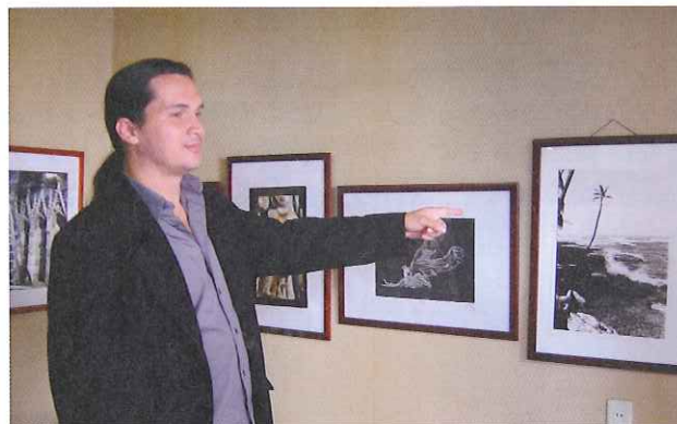
写真家のエンリケ・ロドリゲス・レオン氏