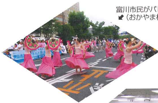
富川市民がパレードに参加 (おかやま桃太郎まつり)