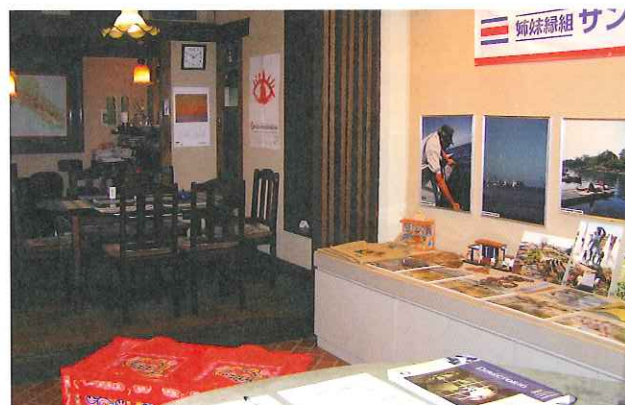
「姉妹縁組サンホセ市展」

岡山市の国際友好交流都市であるコスタリカ共和国サンホセ市を写真などで紹介する「姉妹縁組サンホセ市展」及び、コスタリカの優れた物産を紹介する「コスタリカ物産展」を同時開催しました。