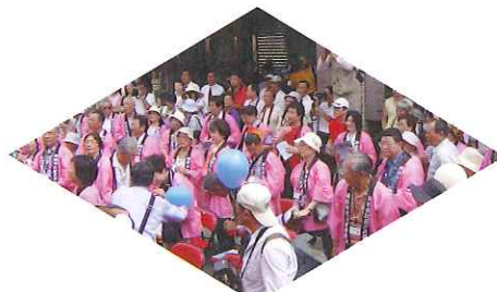
ピンクの法被姿で肉団子祭りに参加