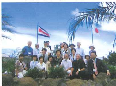
↓岡山公園の桃太郎像の前