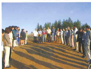
↓米国オレゴン州ペンドルトン「日の出の儀式」