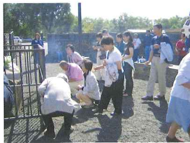
↑先住民の先祖への献花