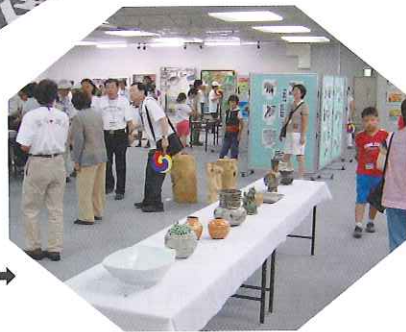
岡山市・富川市友好美術展 (三丁目劇場ギャラリー)