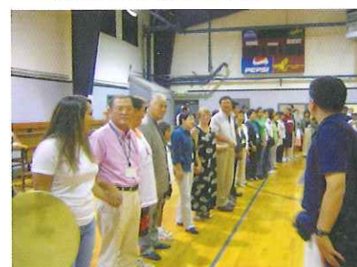
↓米国ウマティラ・インディアン居留区の学校での交流