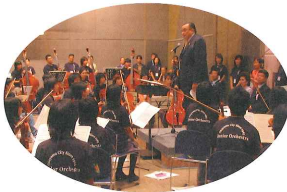
岡山市ジュニアオーケストラの皆さんに激励の挨拶