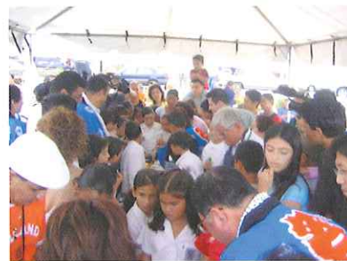
↑岡山公園にてサンホセ市主催の「日本週間2005」交流イベント