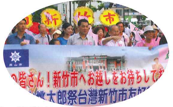
新竹市民がパレードに参加 (おかやま桃太郎まつり)