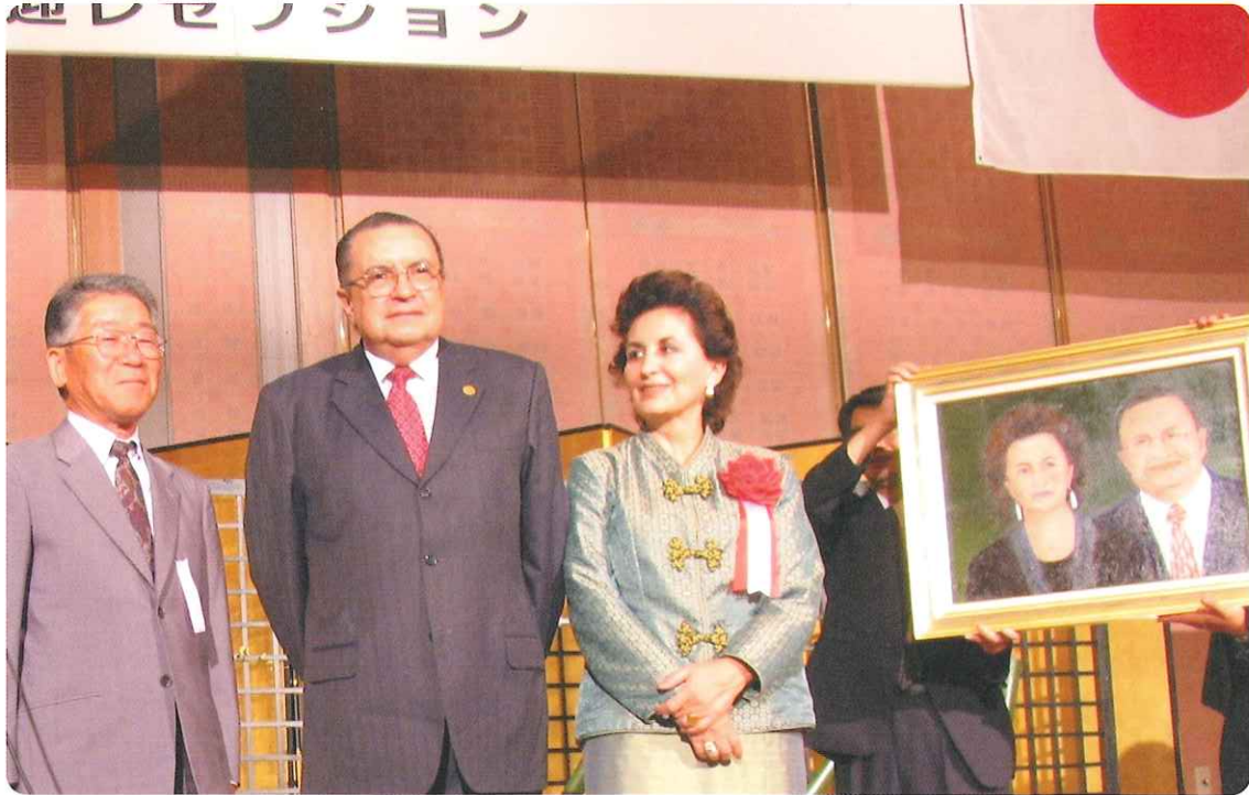
8月20日～21日『コスタリカ共和国大統領一行来岡レセプション』