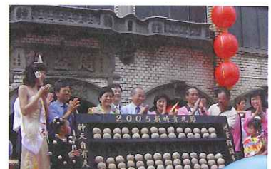
肉団子で作ったそろばんに歓声