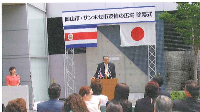
「サンホセスクエア友情の広場」除幕式に出席

コスタリカ共和国大統領一行11名が、愛知万博「愛・地球博」の「中米の日」に出席の後、岡山市を公式訪問されました。滞在中ママカリフォーラム岡山前広場の一角を「サンホセスクエア友情の広場」と命名する式典に出席したほか、西川アイプラザでの岡山市ジュニアオーケストラの演奏の鑑賞や、歓迎レセプション等に参加されました。