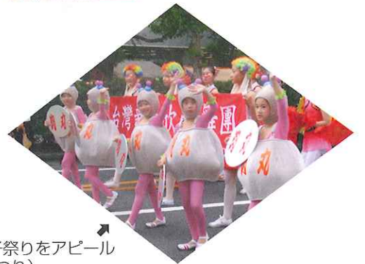
新竹ビーフン肉団子祭りをアピール (おかやま桃太郎まつり)