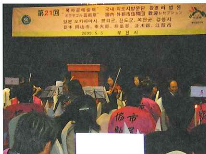
歓迎式・富川フィルによる演奏

第4回目の市民友好親善訪韓団ほか(総勢約190名)がボクサゴル芸術祭への参加等を行いました。