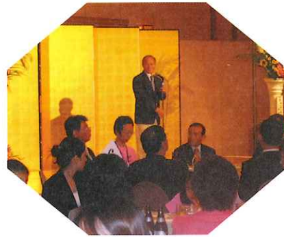
林新竹市長挨拶 (歓迎会)