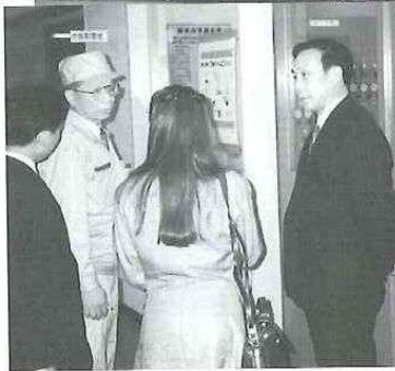
◀ 岡南環境センターで職員の説明に熱心に耳を傾ける白副市長。(左端)