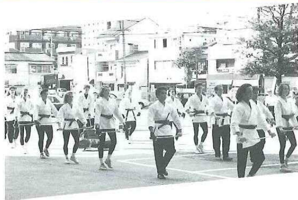
▶ 後楽園での楽しい一時を過ごす一行

世界的に有名なカラーガード「ザ・サンノゼ・レイダース」一行33名が昨年10月来岡しました。一行は、毎年秋に市内で開催する「マーチング・イン・オカヤマ」に特別出演した他、市役所表敬訪問や、市内学校での交流行事への参加など交流を深めました。また、後楽園や瀬戸大橋などを視察し岡山に対する理解を深めました。