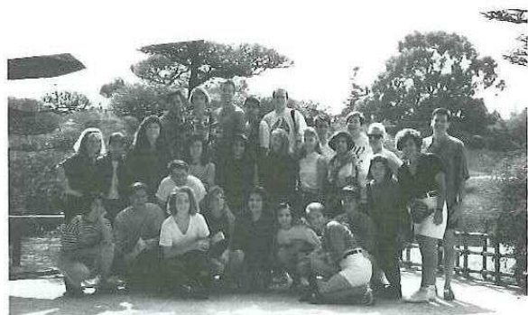
◀ 市役所まで行進する「ザ・サンノゼ・レイダース」