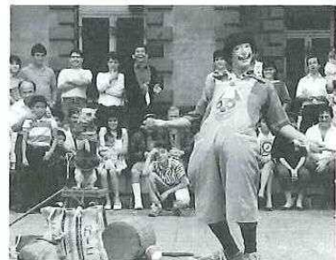
大道芸を楽しむ市民

2年目からは、コスタリカの生活に慣れめったりしたコスタリカの生活を楽しむことができた。