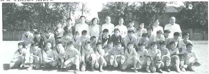
両市のサッカー少年達（後列真中が筆者）

歓迎式では歌、舞踊、折り紙などの文化交流を行い楽しい一時を過ごしました。交流試合は1日3試合合計6試合行いレベルの高いチームと互角に戦い良い試合でした。選手達はお互い別れを惜しみながら再会を約束し会場を後に致しました。