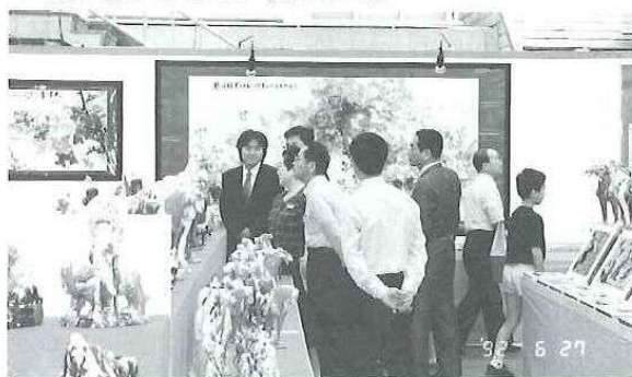
▼ 洛陽市技術研修生も交替で、訪れる見物客への案内役を務めてくれた（写真左端）