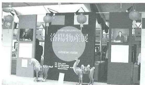
▲ 物産展会場の正面に設置された唐三彩の馬と駝駱も物産展のために洛陽市から贈られたもの。

期間中、洛陽市から用意された記念の工芸品が県内外から訪れた多数の見物客に配られ、記念品を手にした人々は総数2000余点にも及ぶ展示品に遥か洛陽市へ思いを馳せていました。