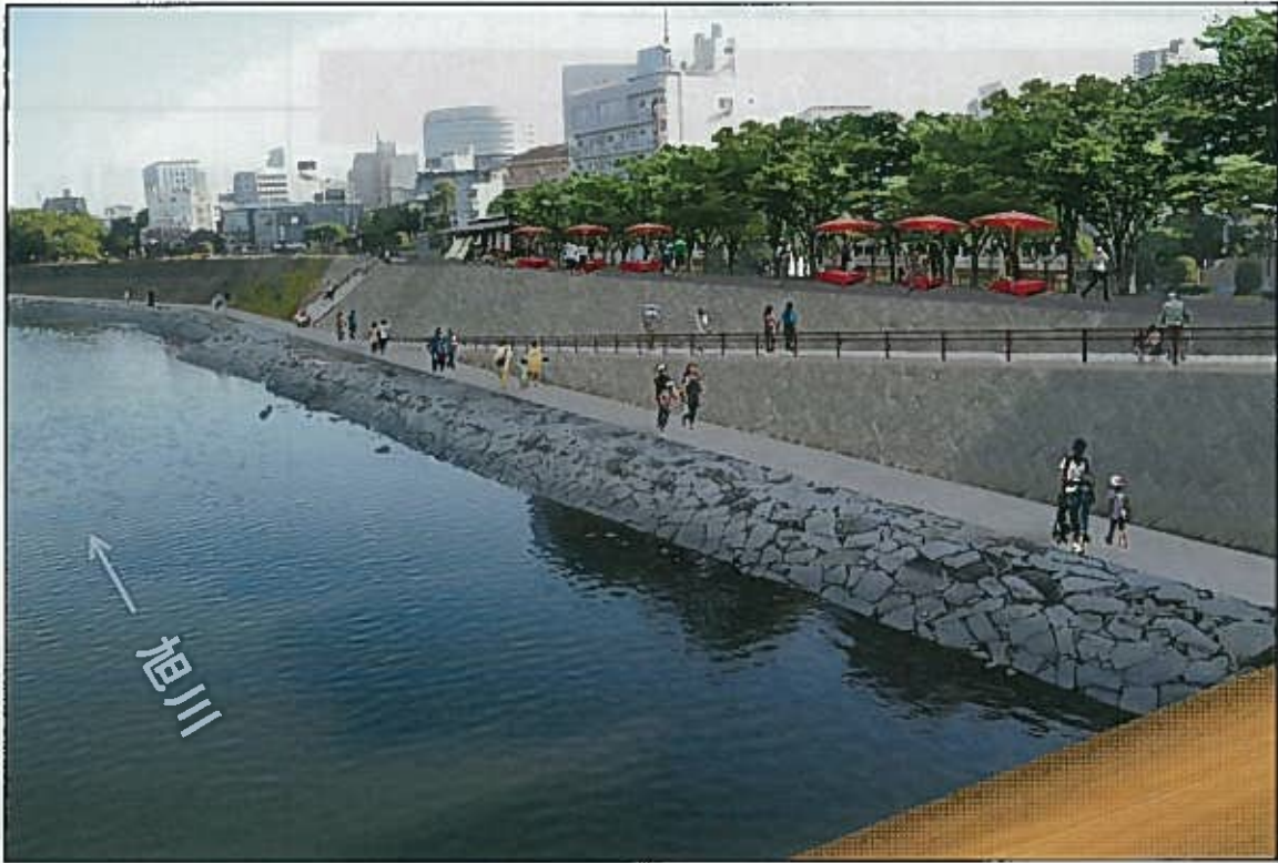
【旭川西側整備イメージ】