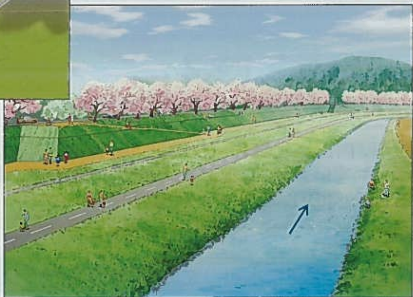
【さくらみち(スロープ・遊歩道) 旭川東側整備イメージ】