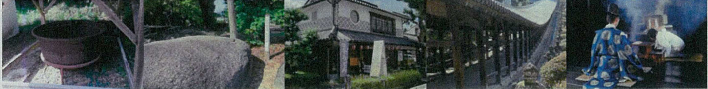
吉備津神社(鳴釜神事)