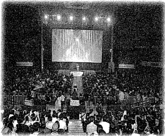
富川市映画祭(イメージ)

3日間 79,000円 *燃油サーチャージ含む (4,400円2014年5月現在) 申込締切:2014年6月13日(金)