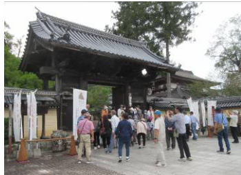
↑誕生寺にも参拝しました。

特大のラッピングバスで行きました！イスやカーテンなどの内装がデニム生地できている、県内唯一のバスだそうです。