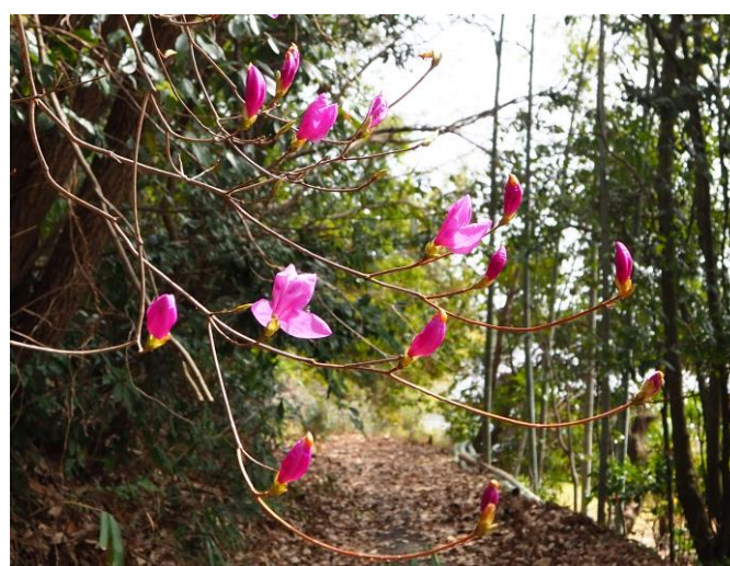
• コバノミツバツツジ