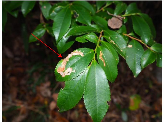
：ハモグリバエ又はハモグリガの食痕