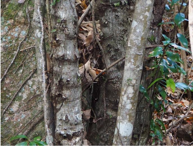
：シロスジカミキリのかじり跡