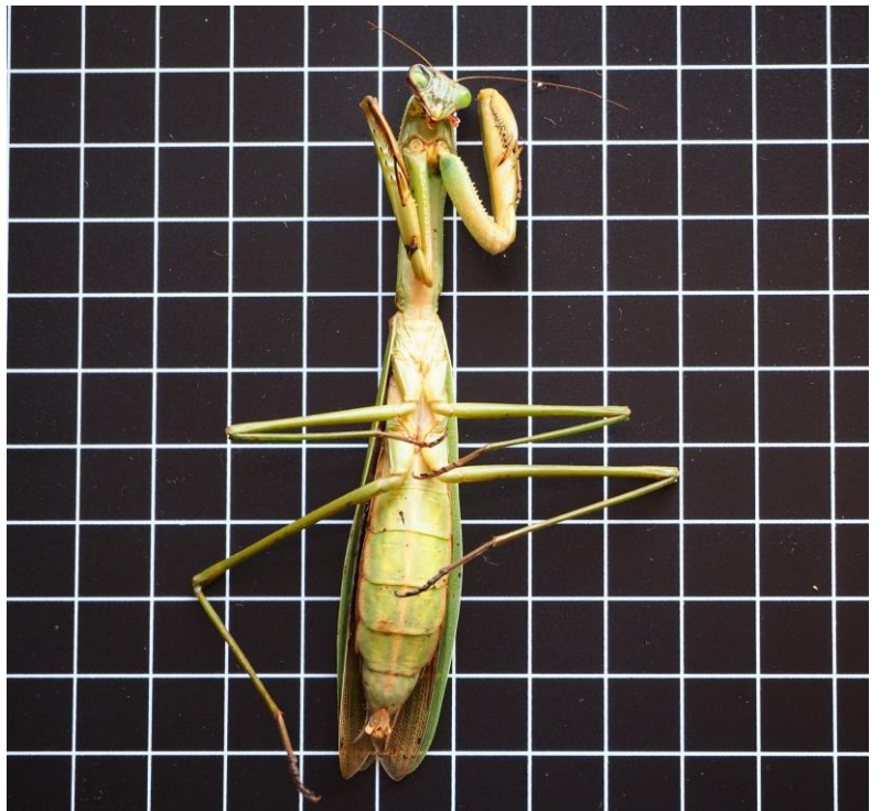
：ムネアカハラヒロカマキリ（外来種：中国か）