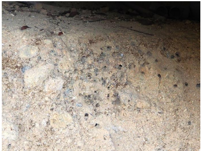
：ケブカコシブトハナバチの巣（土壁に）