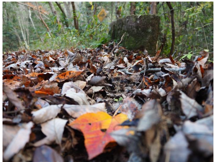
：ニホンイノシシの掘起こし跡