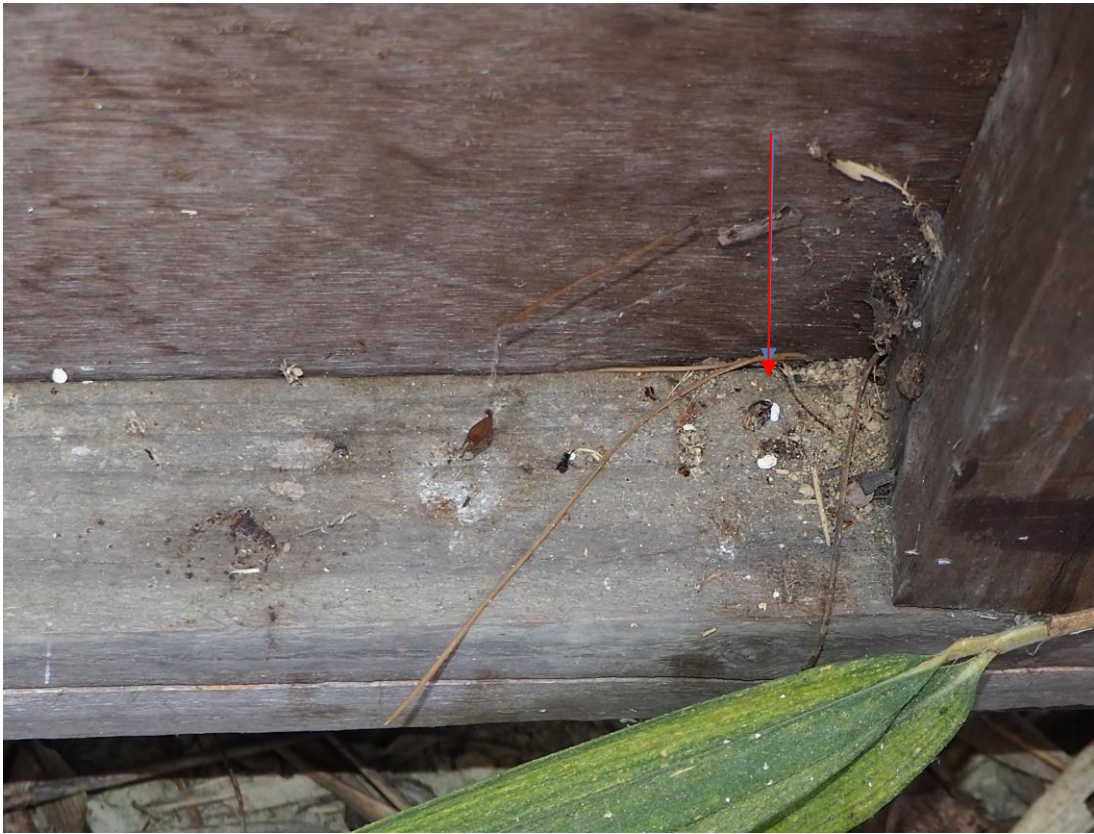
：ヤモリ類の糞（白い部分は尿石）