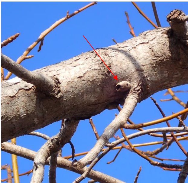
：ヒロヘリアオイラガの繭