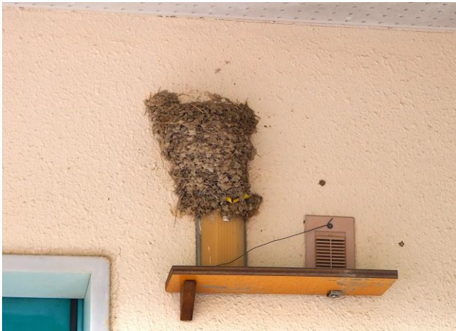
：ツバメの巣 (トイレ棟へ)