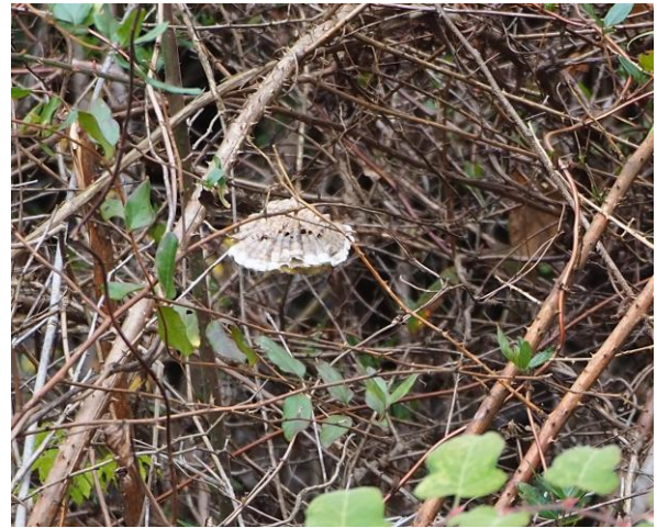
：キボシアシナガバチの巣