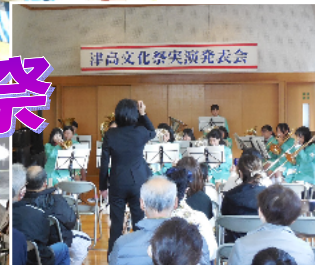
横井小プラスバンド