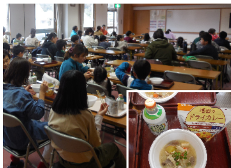
昼食はアルファ米と豚汁