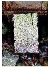
↑ 「太歳神」と彫られています

この神社は、地域にあった疫済様・愛宕様・御崎様・荒神様の4つを合祀したもので、大山様というそうです。4つ並んだ祠には、〇〇神社と書いてあるのもありますが、地元の人たちにとっては〇〇様なんだそうです。