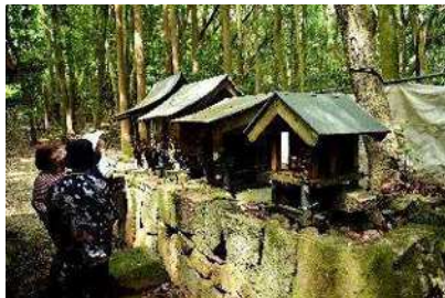
↑ 4つの社が並んでいました

この神社は、地域にあった疫済様・愛宕様・御崎様・荒神様の4つを合祀したもので、大山様というそうです。4つ並んだ祠には、〇〇神社と書いてあるのもありますが、地元の人たちにとっては〇〇様なんだそうです。