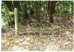
↑ 鳥居の笠木と円柱

「あれは妙見神社じゃないよ。懸幡（かけはた）神社に合祀されたから鳥居を壊して、処分が大変だから残っとんじやる」ですって。え？ 廃神社？ 載せる価値なし？