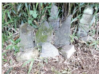
文・福田 瑞江

やり取りをして、岸さんが掘り起こして綺麗に並べたそうです。写真展に出された写真は、こんなところにも文英石仏があつたのかという発見もあつてか優秀賞を受賞されたそう、山陽新聞の取材を受けたり文英石仏の写真集に載ったりしたそうです。この写真は当時からずっと足守公民館に飾られていたそうで、今も飾つてありますので、行かれた際には是非ご覧ください。