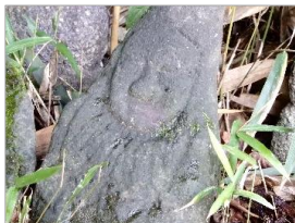
↑優しいお顔の文英様石仏

山上の文英様石仏 文英様石仏とは、戦国時代に岡山市高松地区を中心に作られた石仏のことだそうです。自然石に掘った丸顔で素朴な石仏で、『文英』の刻銘が入っているものがあつたことから、文英石仏と呼ばれるようになってきたそうです。