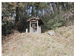
↑小高い場所に社が…