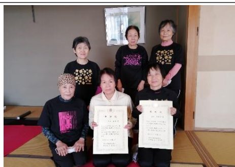
【感謝状を授与された講師を囲むクラブ生】