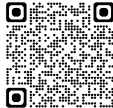
光南台中学校の ホームページの QRコード