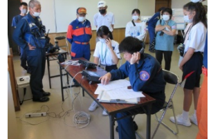
通報訓練の実習もありました。