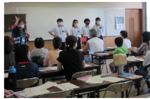
中学生ボランティアがペット防災クイズを出題しました。

最後に非常食を湯煎で作って試食しました。（アルファ米・オムレツ・きな粉マカロニなど）時間が足りないような3時間でしたが「普段の生活で防災について考えることが少ないので実際に体験できてよかった。」という感想もいただきました。これからも自助・共助の備えについてみんなで考えていきましょう。