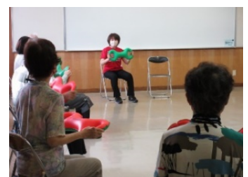
ベルを使って体操

★光南台公民館フェイスブック ※公民館で開催した事業・講座の様子等をご覧ください。