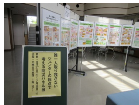
「誰一人取り残さないジェンダーの視点で考える防災パネル展」も同時開催