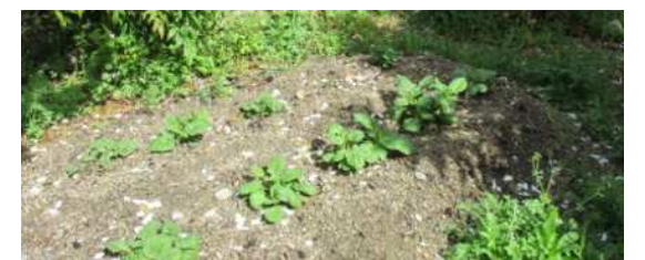
↑4月17日(金)ジャガイモの様子です。