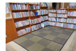
公民館置コーナー