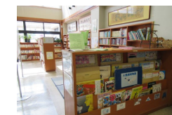
紙芝居・絵本もあるよ

公民館1階ロビーは誰でも利用できます。図書の貸し出しもしています。子どもたちに大人気の畳コーナーもあります。子どもさんと一緒にお気軽にお越しください。