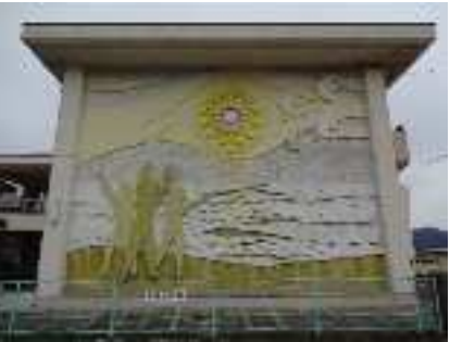
【七区小学校校舎の壁画】