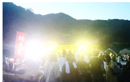
【多くの参加者で賑わうホタルまつりの様子】

5月31日(日)奥迫川のホタルの里に200人以上の老若男女が集まりました。特に今年は若い人の参加が多くなりました。バザーも8品と増えてにぎわいを一層添えました。そして蛸も50匹以上乱舞しました