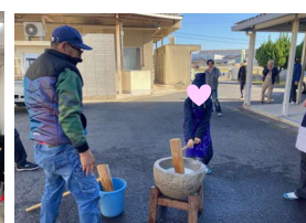
開成もちつき大会(11/29)