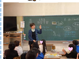
政田小学校防災授業 (11/21)