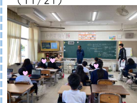
開成小学校防災授業 (12/9)