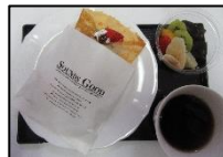
写真は3月のお菓子

【メニュー】 コーヒー、紅茶 各 200円 お菓子のみ 300円 お菓子セット 450円