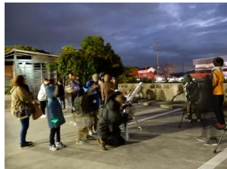
天体観察会の様子