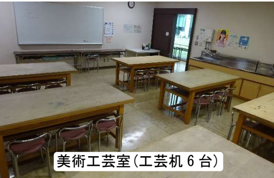
美術工芸室(工芸机6台)