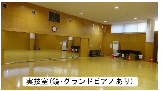
実技室(鏡・グランドピアノあり)