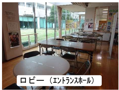
ロビー (エントランスホール)