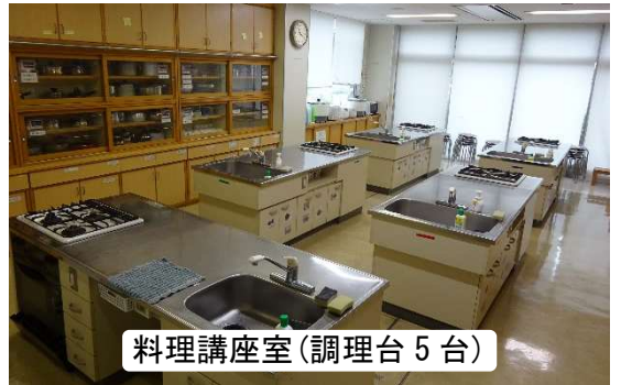
料理講座室(調理台5台)