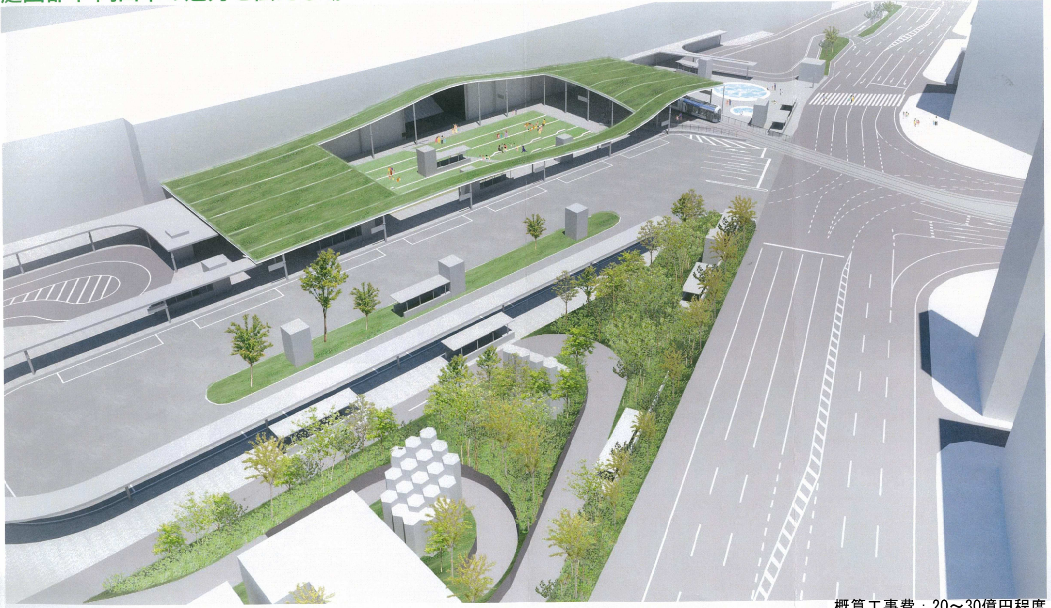
概算工事費：20～30億円程度