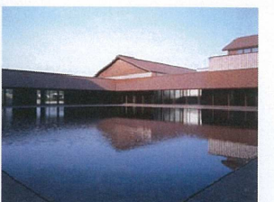
イメージ写真 (島根県グラントワ)