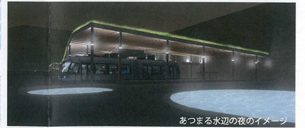
あつまる水辺の夜のイメージ