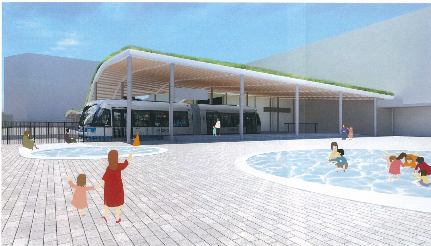
水盤のようにきらめく浅い噴水

設置する噴水は安全面や機能面を考慮し、水面の浅い仕様を想定します。太陽が気持ちいい季節には子どもたちが水に触れあえるようにします。噴水の端は場所によってベンチとなり、憩いの場を形成します。夜間はライトアップし、駅前広場の玄関口として人々を誘導すると共に、視認し易く魅力的な待ち合わせ場所としても機能します。