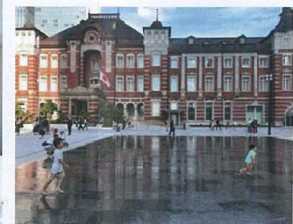
イメージ写真 (東京駅)